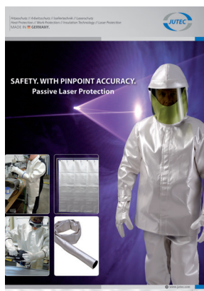
Ochranné pomůcky pro pasivní laserovou ochranu