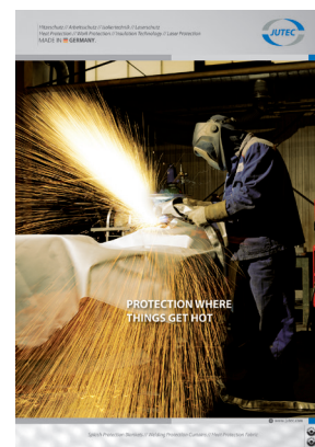
Teplně ochranné tkaniny a matrace