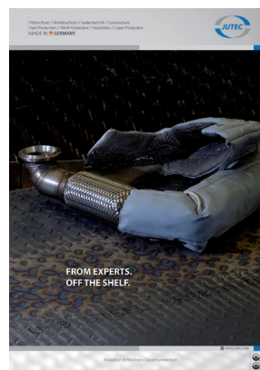
Izolace a tepelná ochrana