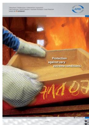
Osobní ochranné pomůcky do vysokých teplot

Vyžádejte si více informací o našich produktech